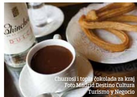
Churrosi i topla čokolada za kraj

19 Museo del Jamon - Španija je poznata po najboljim šunkama, zato obavezno posetite Muzej šunke na Gran Vii. Oni već 30 godina svojim posetiocima dokazuju da se ukus španske šunke zaista duugo pamti.