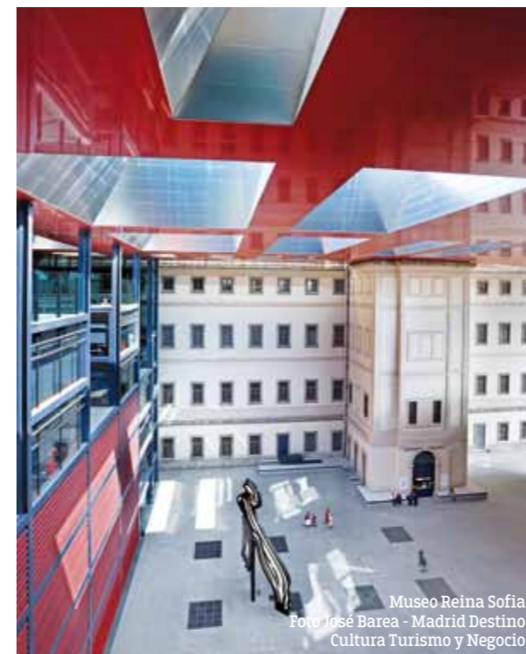
Museo Reina Sofia

možete uz pivo, vino, vermut ili mohito, probati i neki od španskih specijaliteta. Ono što će vam preporučiti su cocido madrileño, churos, tortilla... mada nemojte propustiti ni da probate patatas tres salsas, pastel de cabracho, picadillo de salchichon, croquetas, empanadas, pulpo gallego, a od desetara arroz con leche, flan de huevo, tarta de abuela... Madrid pa i ostali gradovi Španije imaju veliki broj modernih lokala, ali mislim da više vredi otići u njihove tradicionalne taverne i barove. U njima su uglavnom drveni stolovi i stolice, nema muzike, a svi gosti i konobari pričaju međusobno i svako će se nadovezati na vašu priču. I baš u njima možete naučiti i čuti dosta toga o istoriji i običajima ovog grada. Ako Madridanina pitate za preporuku taverne, u šali će vam reći da uđete u onu gde ima najviše salveti i papirića bačenih na podu, što znači da se tu dobro jede i da je hrana izvanredna.