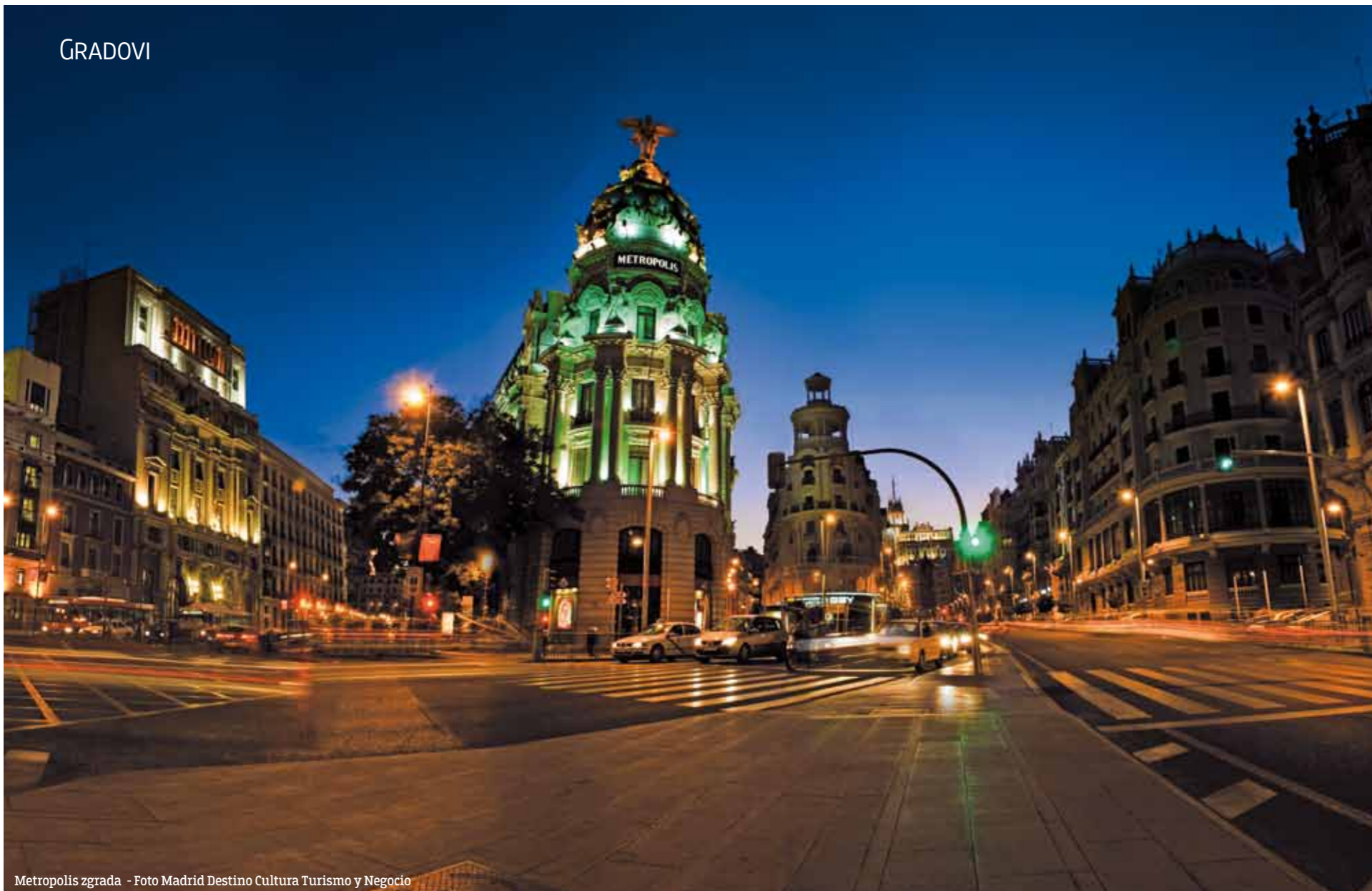
Metropolis zgrada