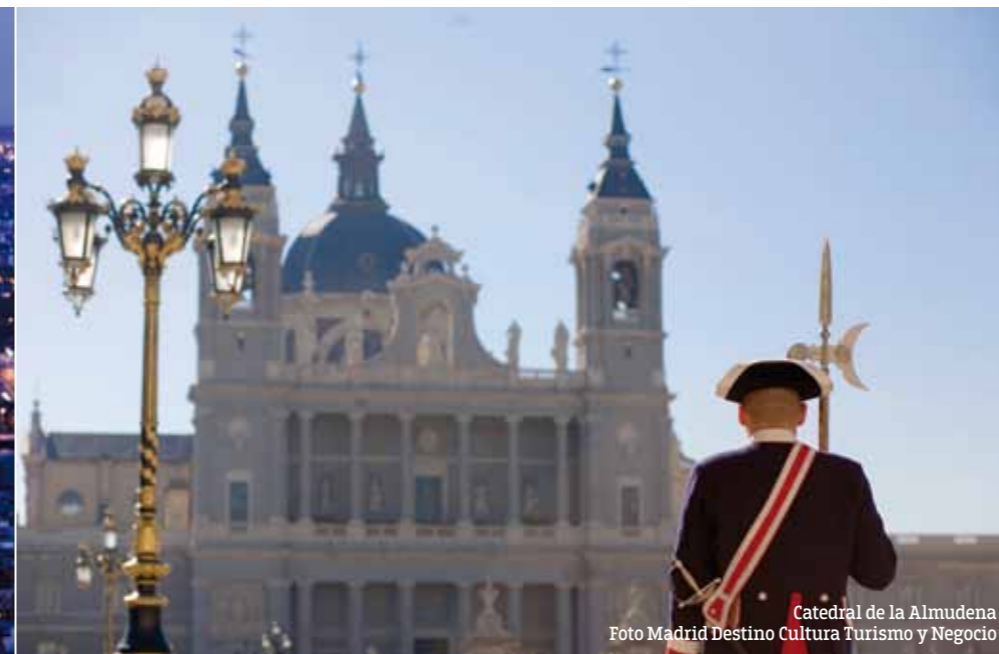
Catedral de la Almudena