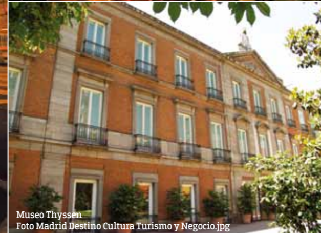
Museo Thyssen.jpg

Ono što ćete, sigurna sam, primetiti, jesu i zastave na prozorima i balkonima. Španci su nacija koja prosto obožava fudbal, a dan kada igra jedan od madridskih klubova je za njih, slobodno možemo reći - praznik. Na skoro svim prozorima se vijori zastava Španije i kluba za koji navijaju, na ulicama ćete tada sreći tek po koju osobu, verovatno turiste, a barovi su puni i atmosfera varira od potpune tišine do ushićenja.