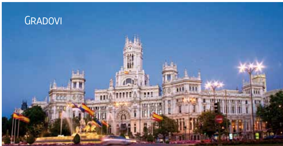
Gradska skupština na Plaza de Cibeles