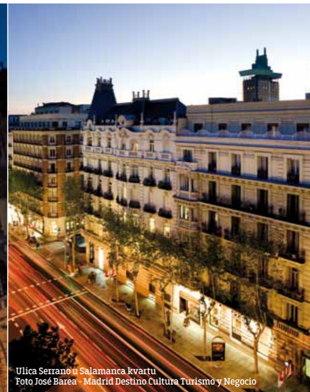
Ulica Serrano u Salamanca kvartu