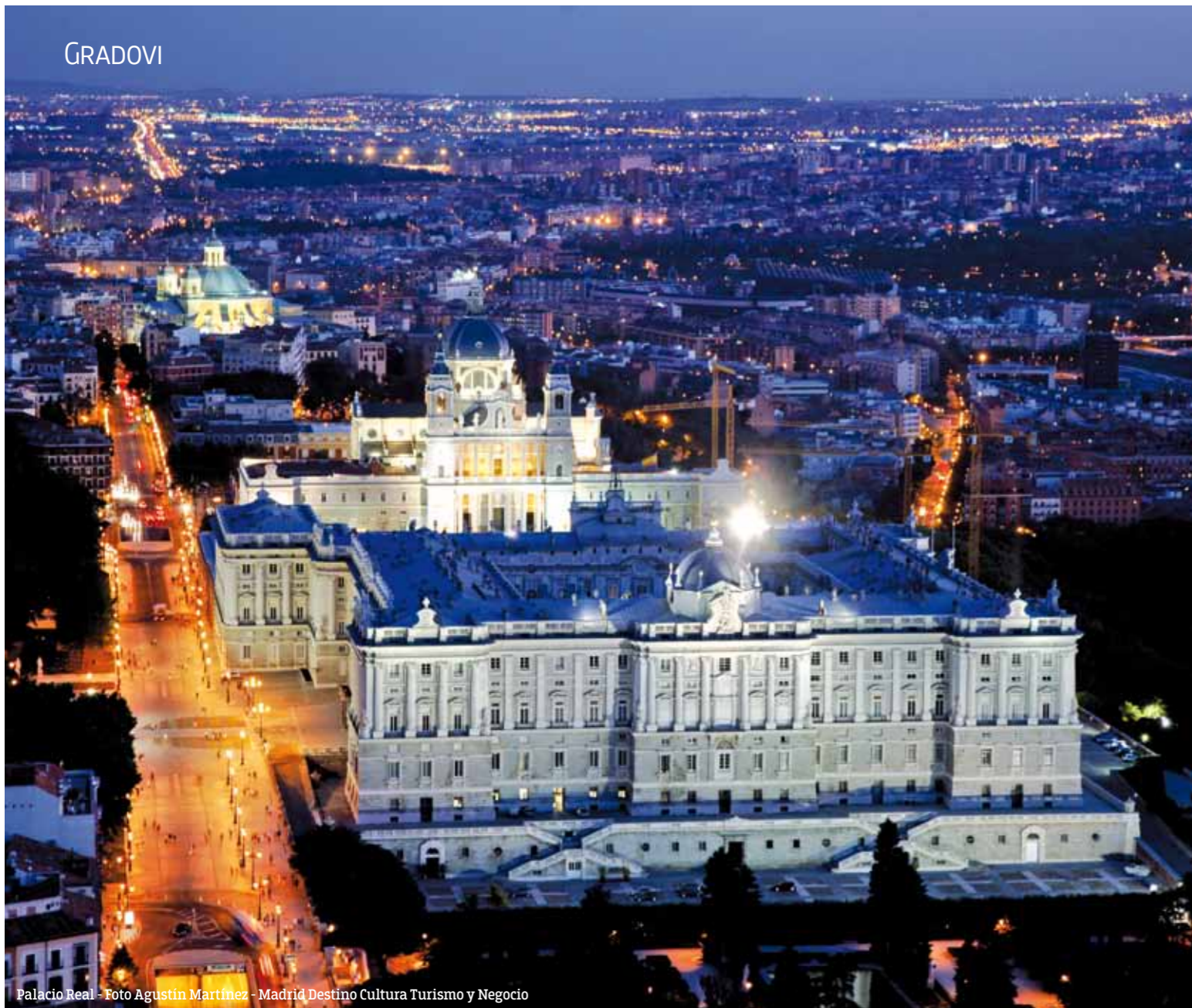
Palacio Real - Foto Agustín Martínez - Madrid Destino Cultura Turismo y Negocio