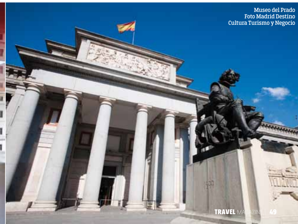
Museo del Prado