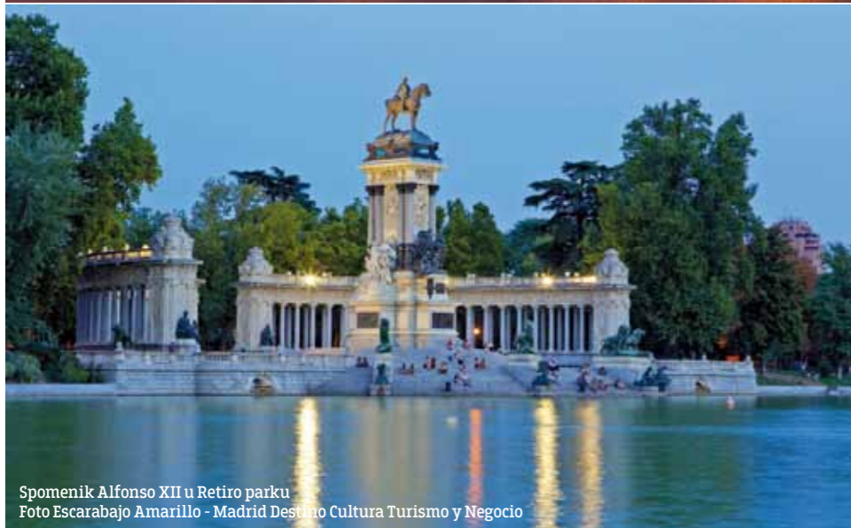
Spomenik Alfonso XII u Retiro parku

9 Plaza de Cibeles - ako nastavite Gran Viam i Ulicom Alkala, dolazite do Trga antičke boginje Sibeles i njene palate u kojoj je smeštena Gradska skupština. Prvobitno je to bila zgrada pošte, ali je 2007. postala sedište Gradske skupštine. Na kružnom toku ispred palate, Real Madrid, kao i španska reprezentacija slave sve svoje pobjede, a malo niže, niz ulicu Paseo del Prado, nalazi se Neptunov trg (Plaza de Neptuno), mesto za proslave konkurentskog Atletiko Madrida.